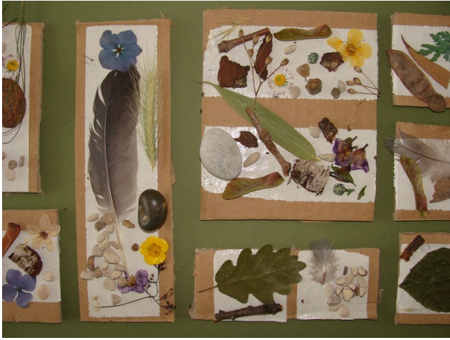
51- Tableau de la nature